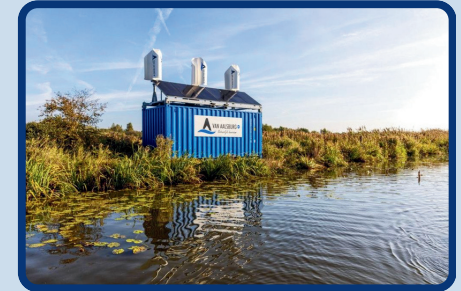
Solar Wind Frame 20FT