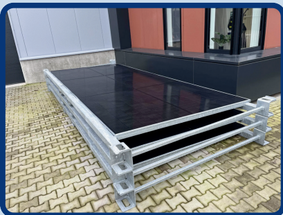
SP6 | 20FT