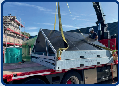
SP6 | 3 X 3