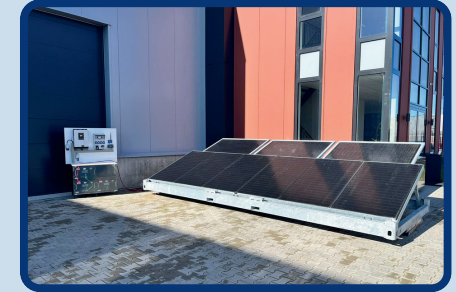
SP9 | 20FT

“Deze aanpak onderstreept de haalbaarheid van 100% emissievrij werken in de bouw- en infrasector.”